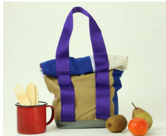
Protótipo de lancheira desenvolvido pelo Re:Costura

A CEP apoiou a candidatura do Re:Costura ao programa PLUS – Seed, da Casa do Impacto (Santa Casa da Misericórdia). O objetivo era realizar um projeto piloto que permitiria testar a viabilidade de um negócio social de upcycling têxtil em média escala (“Refeita”). O projeto foi rejeitado na 4ª e última fase de seleção, tendo sido apontado um excessivo foco na produção dos protótipos têxteis em detrimento do modelo de negócio.