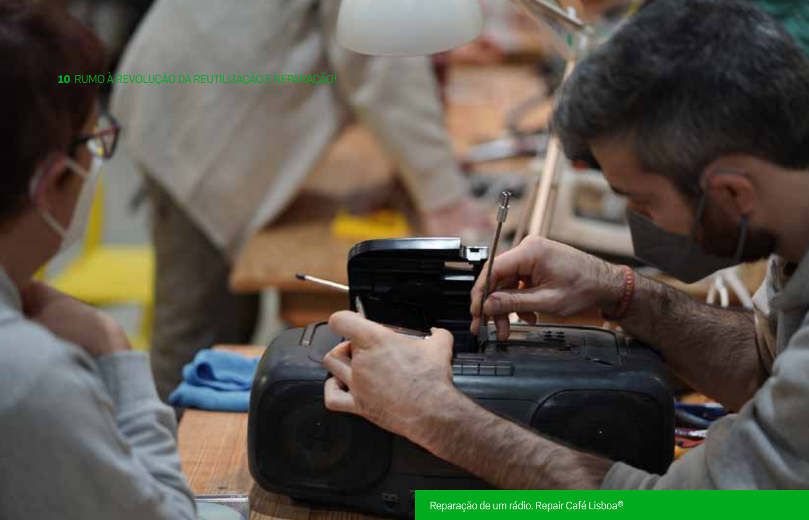
Reparação de um rádio. Repair Café Lisboa®