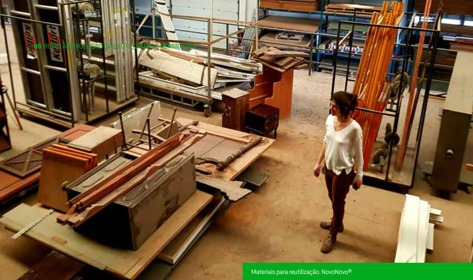
Materiais para reutilização. NovoNovo®