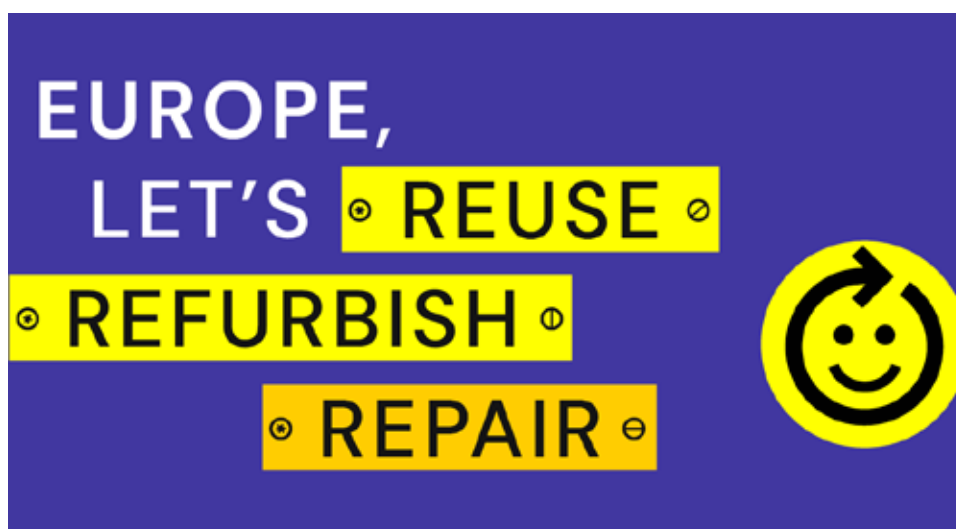
Imagem 2- Campanha "Right to Repair" (Right to Repair, N.D)

Considerando o atual ambiente construído, a fase de fim de vida é essencial para a reutilização dos recursos presentes, sendo a implementação obrigatória de auditorias pré-demolição (ou seja, desconstrução) em edifícios 20 uma ferramenta crucial, pois permite inventariar componentes, materiais e resíduos, e prever a sua aplicação futura [18]. Já para novos edifícios, a conceção circular deve ter um papel de destaque e deve ser complementada com a adoção de passaportes de materiais.