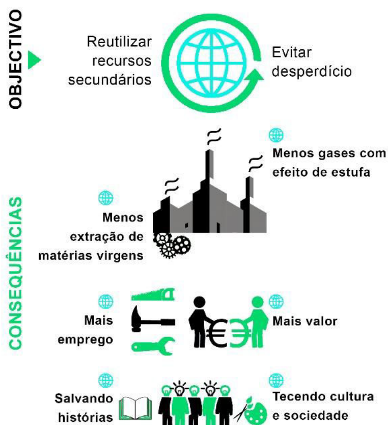
Imagem 1- Benefícios da reutilização e reparação (CEP, N.D)

Reparação: ato ou efeito de reparar, de restaurar ou de consertar, de modo a permitir a reutilização.